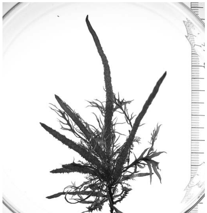
長日条件下で生育した2次枝