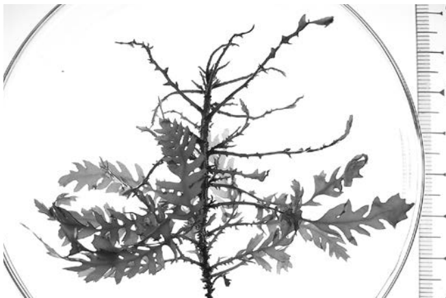
短日条件下で生育した2次枝

アカモクの生殖器床形成に関する光周期の影響を明らかにするため、短日条件の長い暗期中に1時間の明期を挿入した光中実験を行った結果、アカモクの生殖器床形成が誘導されたため、予想どおりアカモクの生殖器床形成は、光周性により制御されていることを示すことが出来ました。また光中断には、多くの褐藻類で形態形成に関与することが報告されている青色光だけでなく、緑色光も有効であることが示されました。つまりアカモクは、青色だけでなく緑色光も使って日長を測っていることに成ります。緑色光と青色光の波長域はとても近いため、今後光中断反応の光強度依存性を慎重に解析する必要がありますが、アカモクが緑色光にも感受性を示すことはアカモクの光環境適応と光受容に関わる分子機構の2つの観点から大変興味深い結果でした。水に吸収されにくい緑色光を、感受し形態形成を行うことが出来る性質は、光強度や光の色の両面で利用でき