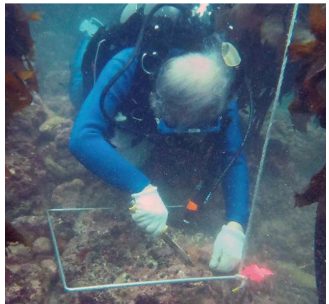
(2011年10月5日 下田にて、調査風景)

先生は著書も多く、はじめに三省堂から「海藻の謎」、ついで講談社ブルーバックスの「海の中の森の生態」、3番目に新潮選書の「海の森の物語」と海藻物語三部作を執筆しました。この3つの著書はレイチェル・カーソンの海洋生物学のノンフィクション三部作、「潮風のもとで Under the Sea-Wind」、「われらをめぐる海 The sea around us」、「海辺 The